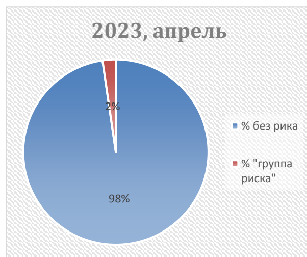
Рис. 2. Процент учащихся «группы риска» по вовлечению в криминальные субкультуры по результатам