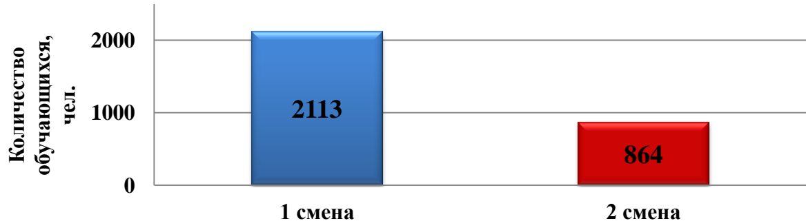
Рис. 1. Количество школьников, обучающихся в 1 и 2 смены

Во 2-11-х классах занятия проходили в условиях шестидневной учебной недели, в 1-х классах – пятидневной учебной недели. 4 из 5-ти школ городского округа работали в двухсменном режиме (рис. 1). Число обучающихся в 1-ую смену – 2113 человек; во 2-ую смену – 864 человека.