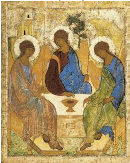
7. А. Рублев. Троица.