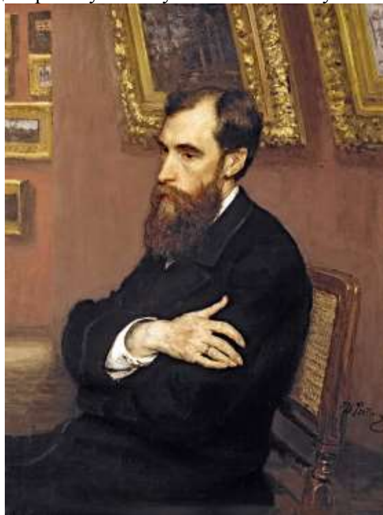
2. И. Е. Репин. Портрет П. М. Третьякова.