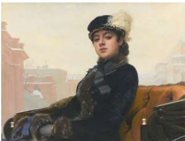
3. И. Н. Крамской. Неизвестная.