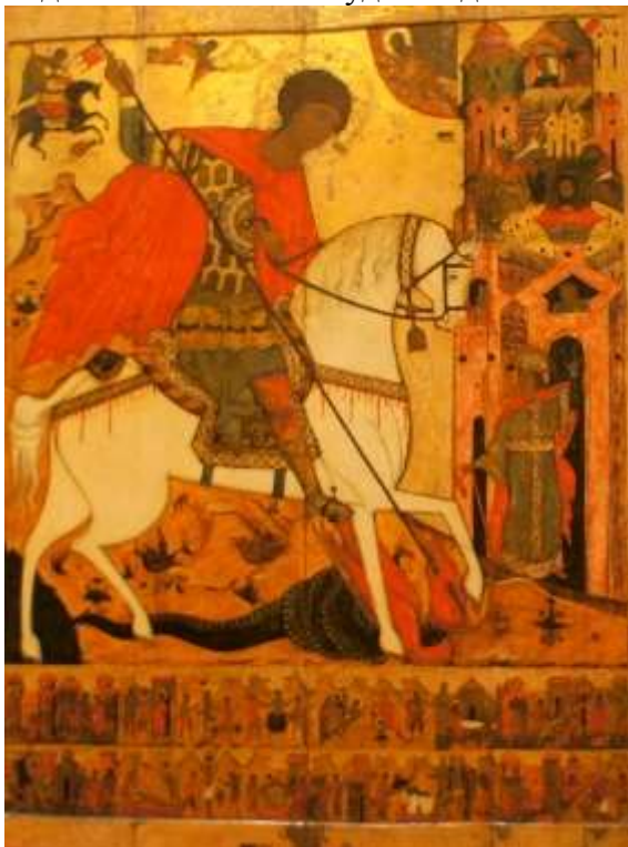
1. Чудо Георгия о змие с житием.

4. Один из экспонатов будет выделен и займет центральную стену. Какой и почему?