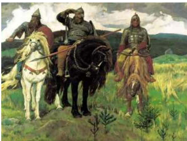
9. В. М. Васнецов. Богатыри.