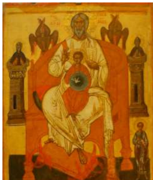
10. Отечество с избранными святыми.