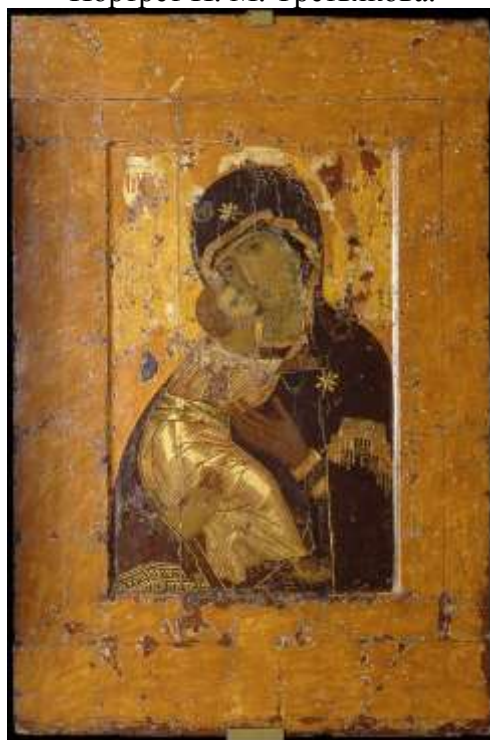
4. Владимирская икона Божией матери.