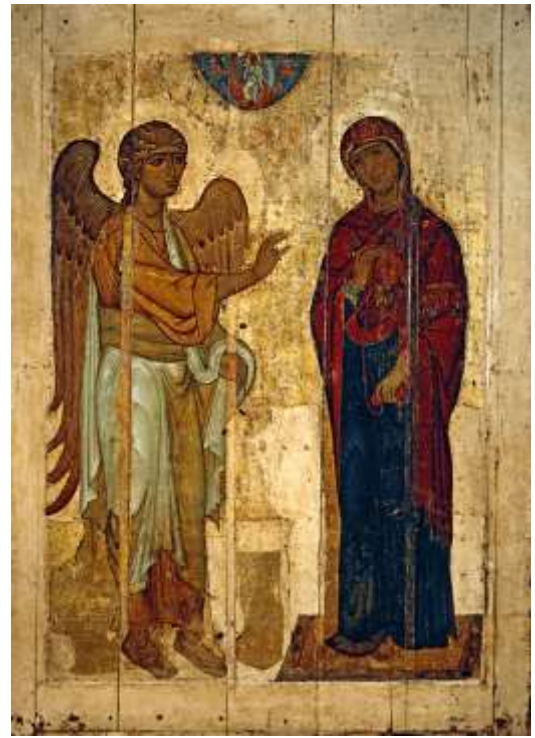
6. Устюжское Благовещение.