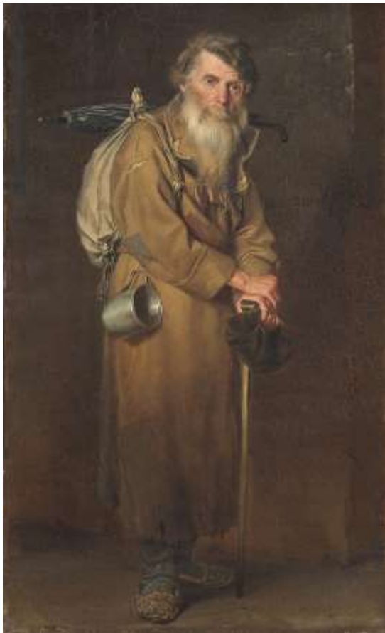
5. В. Г. Перов. Странник.