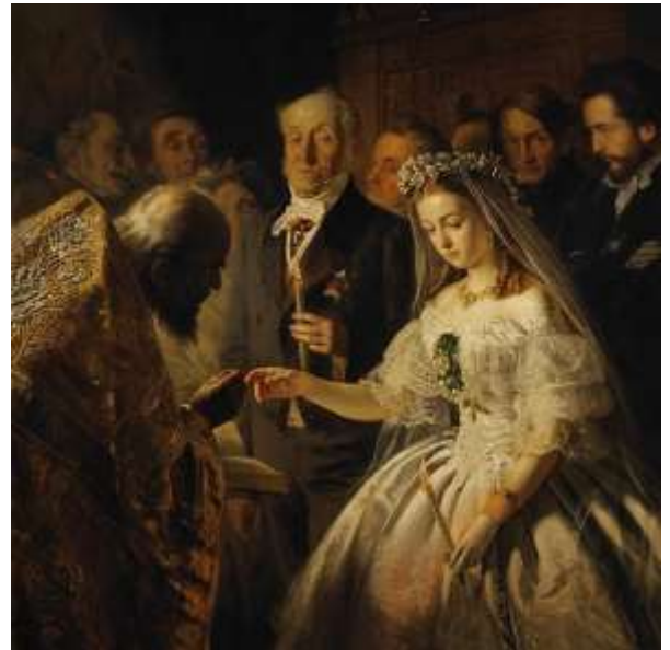
8. В. В. Пукирев. Неравный брак.