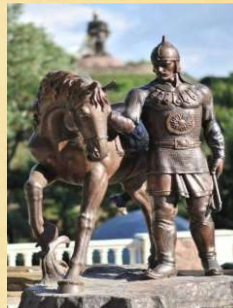
ПАМЯТНИК ДОБРЫНЕ НИКИТИЧУ В КОРОСТЕНЕ