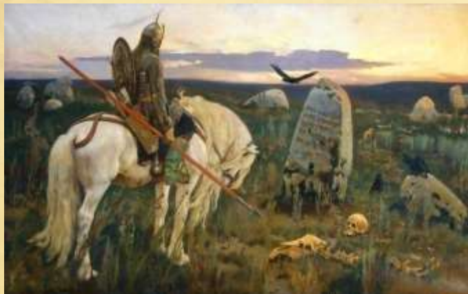
Виктор Михайлович Васнецов «Витязь на распутье»

В середине XIX века русские былины начали активно публиковать и исследовать. Художественная среда живо отреагировала на этот процесс, и молодые художники стали осваивать богатырскую героику наряду с другими фольклорными сюжетами.