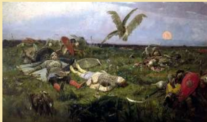
Виктор Михайлович Васнецов «После побоища Игоря Святославича с половцами»