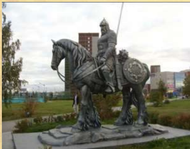
ПАМЯТНИК ИЛЬЕ МУРОМЦУ В ЕКАТЕРИНБУРГЕ