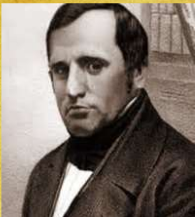
Сахаров Иван Петрович

Термин «былина» вошёл в обиход в 1839 году, когда фольклорист и этнограф И. П. Сахаров приступил к изучению этого самобытного жанра.