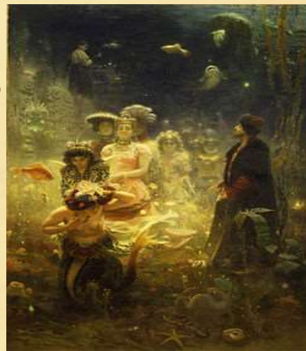
Илья Ефимович Репин «Садко»