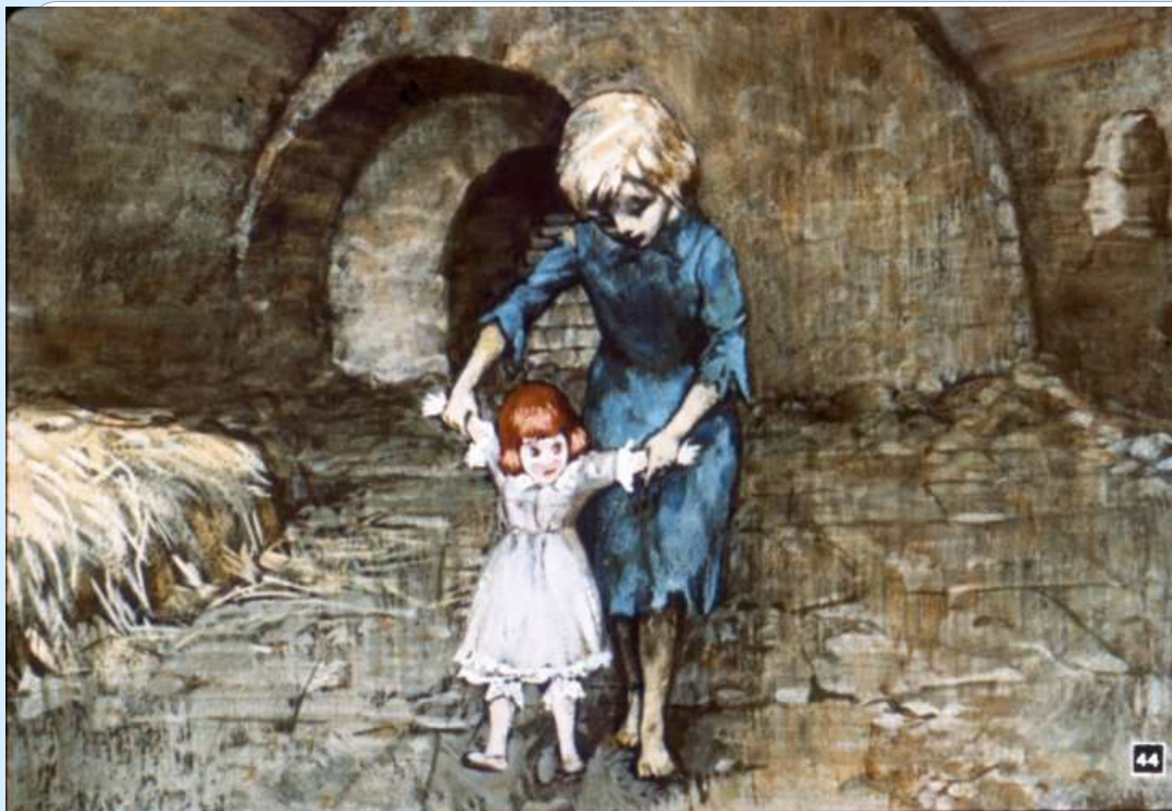
Девочка стала ходить, водя за собой свою дочку.

Осенью девочка чахнет от болезни. Вася рассказывает о больной несчастной Марусе сестре, уговаривает отдать на время её лучшую куклу, подаренную покойной матерью. И «маленькая кукла сделала почти чудо» .