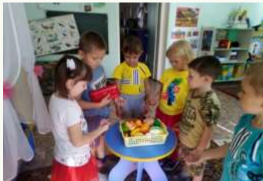
Формирование представления о товаре