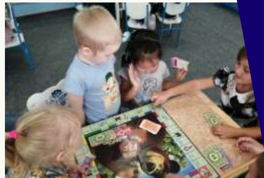
Экономическая игра «Монополия»