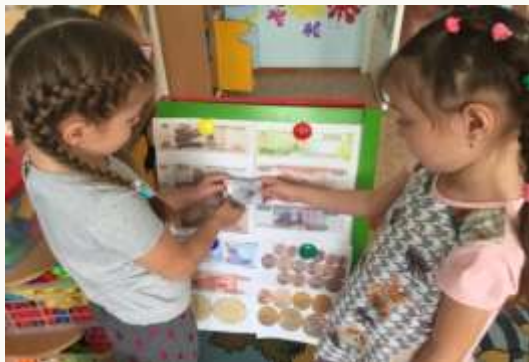
Знакомство с денежными знаками