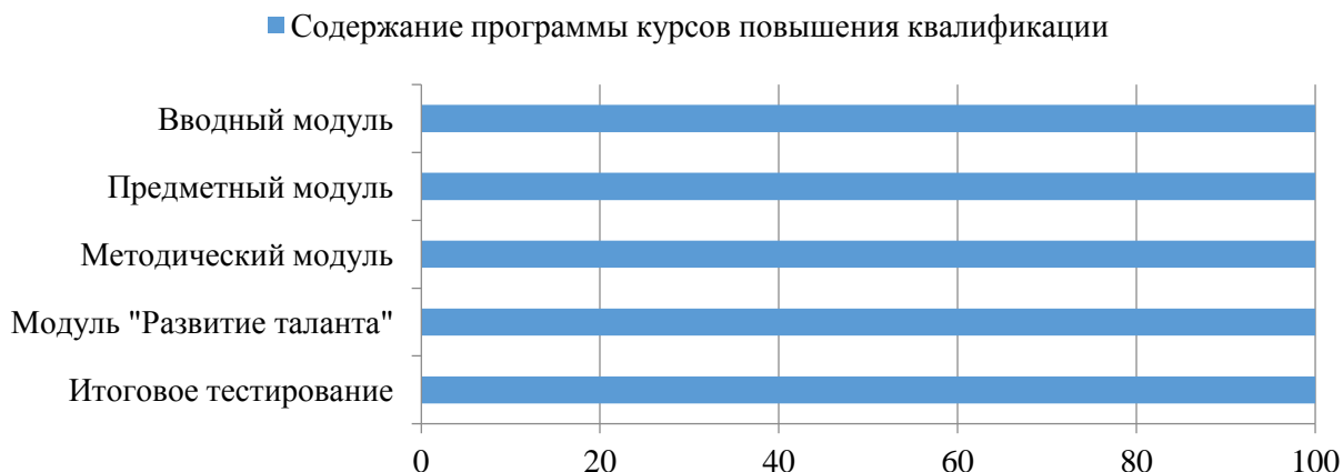
Рис. 3. Участие учителей МБОУ «СОШ № 30» в курсах повышения квалификации, по модулям, %

Педагоги МБОУ «ООШ № 29» не были включены в число слушателей курсов повышения квалификации по совершенствованию предметных и методических компетенций педагогических работников (рис. 4).