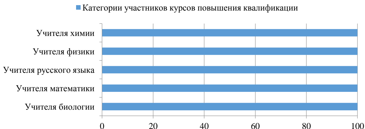
Рис. 2. Участие учителей МБОУ «СОШ № 30» в курсах повышения квалификации, по категориям, %