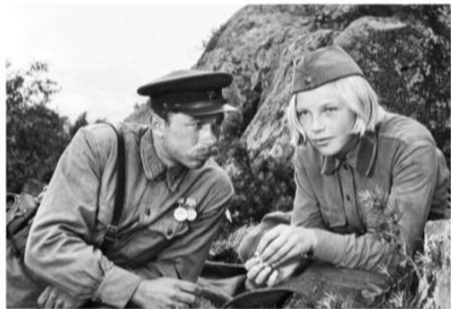
Кадры из художественного фильма по книге Бориса Васильева «А зори здесь тихие...» 1972 года.